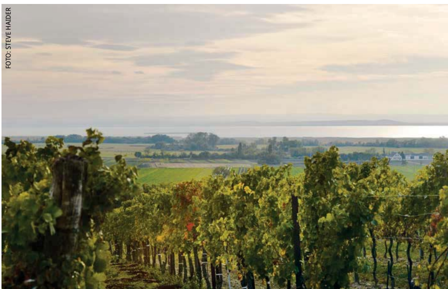
Weites Land: Blick von den Golser Weinbergen auf den Neusiedlersee

nem markanten Einfluss des Windes. Ganz im Südwesten der eigentliche „Seewinkel“ rund um Illmitz und Apetlon. Hier sind auch die Salzlaken zu finden. Sie sind ein markantes Element des Nationalparks Neusiedlersee-Seewinkel und der UNESCO-Welterbe Region. Diese salzreichen Tümpel werden von einem gigantischen unterirdischen Mineralwassersee gespeist. Wenn das Wasser an der Oberfläche verdunstet, werden die Mineralsalze durch den Wind in die Weingärten geweht. Diese leichte Salzigkeit ist bei den Zweigeltweinen aus diesem Teil des Herkunftsgebietes wahrnehmbar. Vielleicht noch stärker bei den Süßweinen der hier ansässigen Winzer.